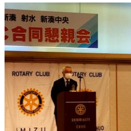
花木ガバナー補佐